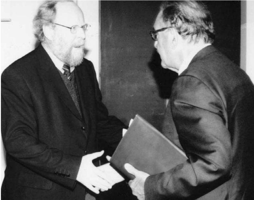
Der Kuratoriumsvorsitzende der Bundeskanzler-Willy-Brandt-Stiftung, Bundestagspräsident Wolfgang Thierse, gratuliert dem Referenten zu seinem Beitrag.

ΒΙΛΙ ΜΠΡΑΝΤ - «ΕΝΘΥΜΗΜΑΤΑ ΔΙΠΛΑ ΣΕ ΕΝΑ ΦΙΛΟ»