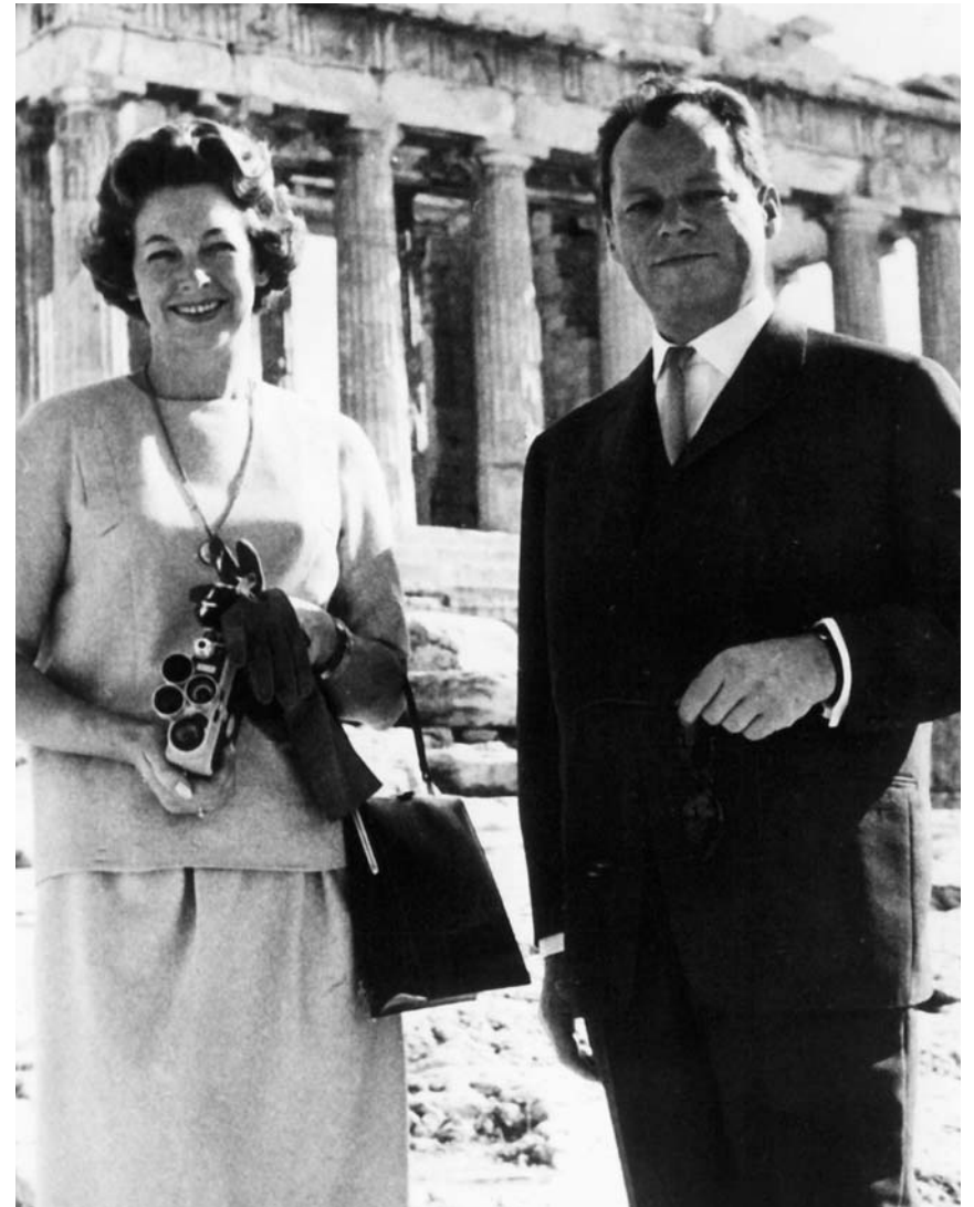
Ein Foto aus früheren Tagen: Willy und Rut Brandt am 12. November 1960 beim Besuch der Akropolis in Athen.

Είπα ήδη ότι οι Έλληνες εθεώρησαν πάντοτε εαυτούς ως ευρωπαϊκόν λαόν και δι' αυτόν κυρίως τον λόγον χαιρετίζω το ότι μετά την πικράν απομόνωσιν κατά την διάρκειαν της κυριαρχίας της χούντας ετέθη και πάλι εις κίνησιν η σύνδεσις της χώρας σας προς την Ε.Ο.Κ. και επιδιώκεται ήδη η πλήρης ένταξις της εις την Κοινότητα. Δεν δυνάμεθα εδώ να προαποφασίσωμεν αυτό δια το οποίον θα γίνουν διαπραγματεύσεις εις τας Βρυξέλλας, είναι όμως ευχάριστον ότι διευρύνεται η αντίληψις ότι από κοινού δυνάμεθα καλύτερα παρά μόνοι να αντιμετωπίσωμεν τα οικονομικά και πολιτικά μας προβλήματα, όπως ελπίζω να πραγματοποιήσωμεν την ελευθερόφρονα και κοινωνικήν δημοκρατίαν.