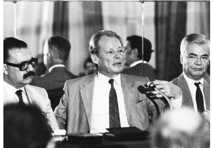
Verleihung der Ehrendoktorwürde an Willy Brandt, Vorsitzender der SPD, durch die Panteios Hochschule für Politische Wissenschaften, 21. Juni 1975.