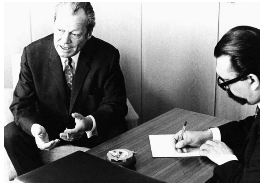
Interview mit Bundeskanzler Willy Brandt für die „Weltwoche“ am 9. Juni 1971 in Zürich.

In seinem Rückblick auf die Zeit des Exils sprach Willy Brandt auch von seinen Erfahrungen im Jahr 1936, als er sich als norwegischer Student getarnt monatelang in Berlin – der Höhle des Löwen – aufhielt, um die örtliche Untergrundzelle der Sozialistischen Arbeiterpartei Deutschlands (SAP) zu betreuen und Eindrücke über das Alltagsleben im nationalsozialistischen Deutschland zu gewinnen. Für ihn war wichtig – und dies konnte ich aus persönlicher Erfahrung intensiv nachvollziehen –, dass