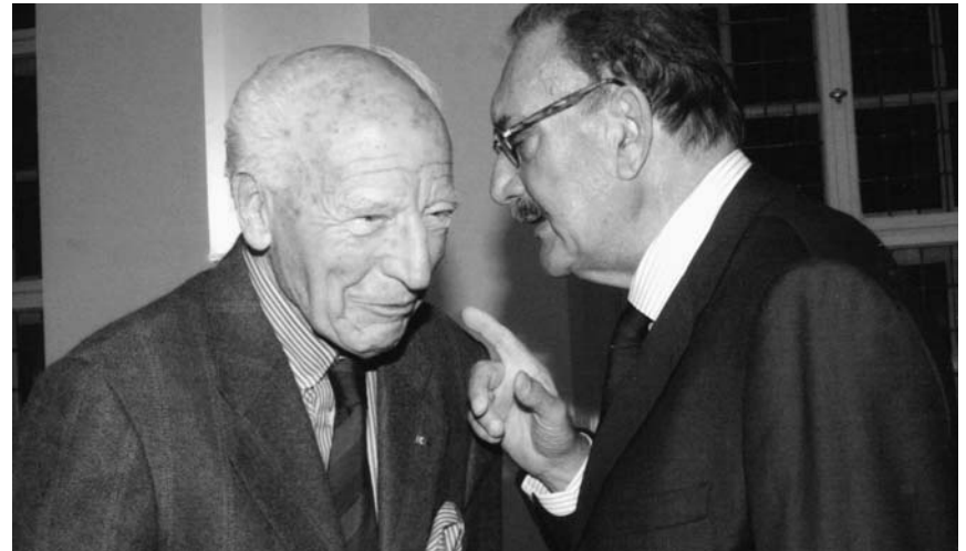
Im Gespräch mit Altbundespräsident Walter Scheel. Συζήτηση με τον πρώην Ομοσπονδιακό Πρόεδρο Βάλτερ Σέελ.

Την Παρασκευή 21 Απριλίου 1967, την ημέρα που έγινε το πραξικόπημα,