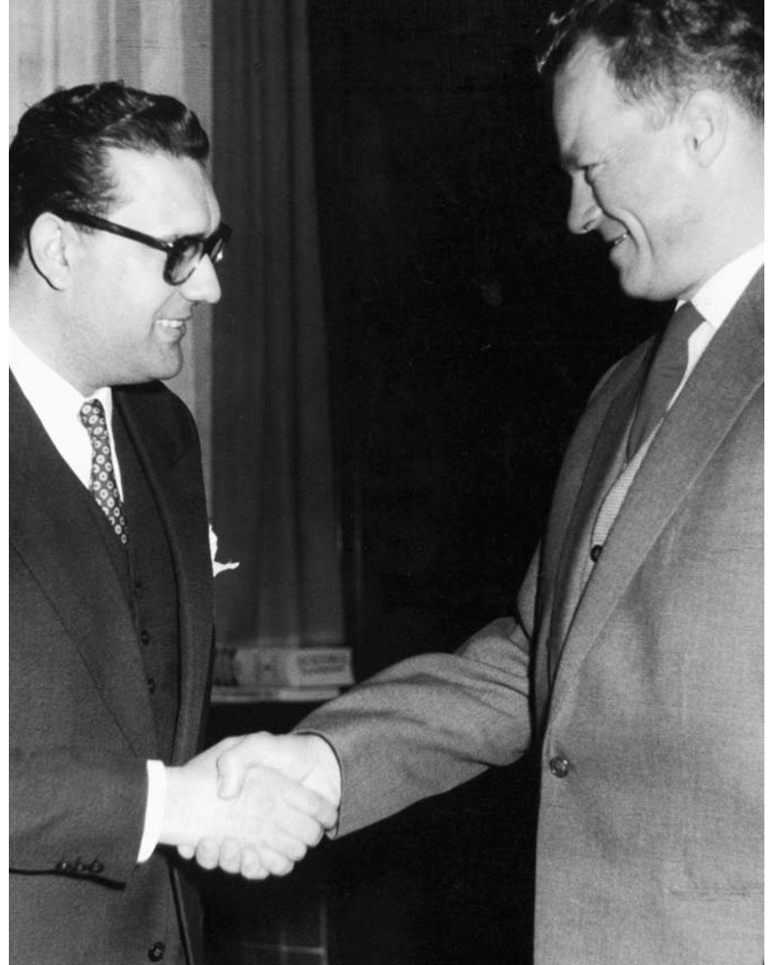
12. November 1957: Erstes Treffen mit dem frisch gewählten Regierenden Bürgermeister von Berlin, Willy Brandt.

12 Νοεμβρίου 1957: Πρώτη συνάντηση με τον νεοεκλεγέντα δήμαρχο και πρωθυπουργό του ομόσπονδου κρατιδίου του Βερολίνου, Βίλι Μπραντ.